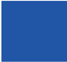
PANTONE Blue 072C C:93 M:75 Y:0 K:0

Profilmfärgerna ska i möjligaste mån användas genomgående i all kommunikation för att skapa igenkänning och tydlighet. Skrivna text i dokument bör alltid vara svart eller vit för bästa läsbarhet beroende på bakgrund eller bakgrundsfärg.